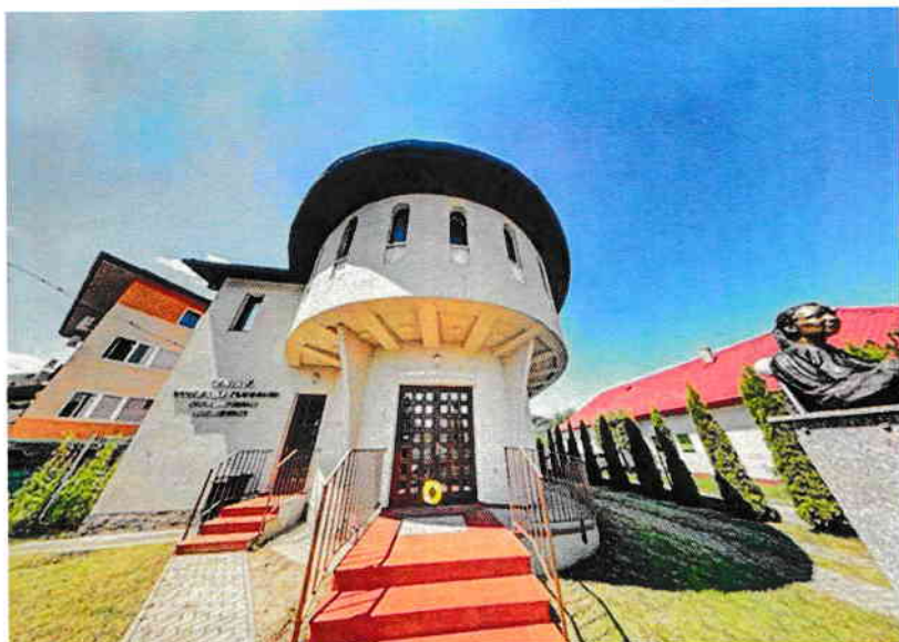
Fundația „Ion și Livia Piso” – Muzeul Nobilimii Române Maramureșene – Vișeu de Sus, Maramureș

3.1 proiectarea și construirea, cu resurse financiare proprii, a CENTRULUI NOBILIMII MARAMUREȘENE DE ORIGINE ROMÂNĂ la Vișeu de Sus (planuri și detalii interior, arh. M. Danciu), inaugurat în 2014, în prezența Casei Regale a României (vezi imaginea alăturată, precum și muzeulnobilimii.ro sau muzeulnobilimii.com).